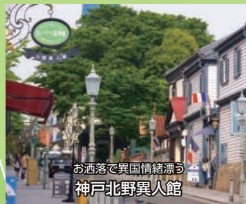
お洒落で異国情緒漂う 神戸北野異人館