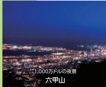
1,000万ドルの夜景 六甲山